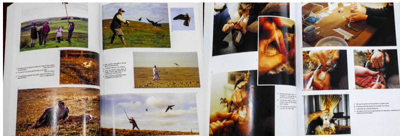
写真を使った解説ページも多

鷹匠が野生の猛禽の保護に貢献したエピソード、リハビリの際の倫理、鷹狩りに関係する法律、著者の考える鷹匠の哲学など。